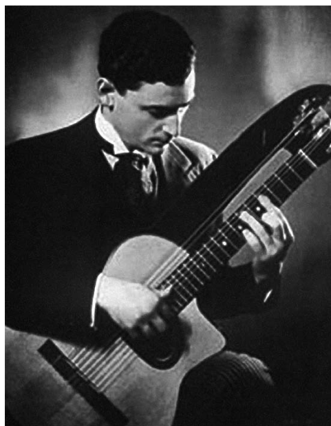
Maccaferri con su primer prototipo Selmer (1932)

La mayoría de guitarras Selmer usaban madera de palo rosa de la India laminado para el cuerpo, nogal para el mástil, ébano para el diapason y picea sólida para la tapa. La combinación de estas maderas junto con el particular sistema de construcción produjo unas guitarras con prestaciones acústicas únicas. Durante los veinte años de producción de guitarras Selmer se fabricaron menos de mil unidades. En la actualidad hay pocas supervivientes que estén en buenas condiciones y por esta razón alcanzan precios muy altos. Algunas pertenecen a personajes ilustres como Stochelo Rosenberg (número 504), Fapy Lafertin (número 501) o John Jorgerson (número 574). Django