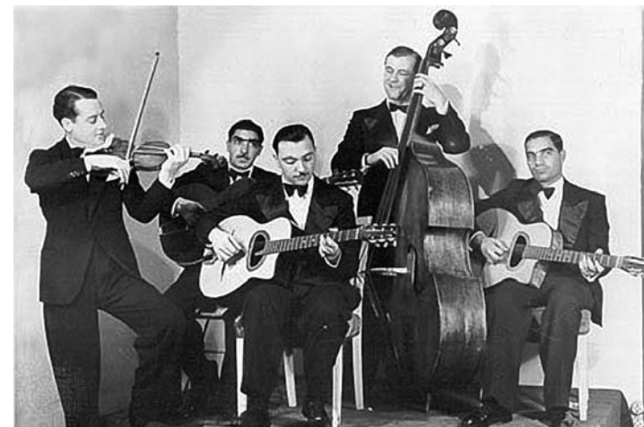
Quintet of the Hot Club of France

Otro elemento clave para comprender el sonido de esta guitarra es el uso de púas gruesas, entre 2.5 mm y 5 mm. Django utilizaba púas hechas de caparazón de tortuga, aunque en la actualidad el comercio de carey está prohibido pero pueden conseguirse púas de hueso, de cuerno, de made-